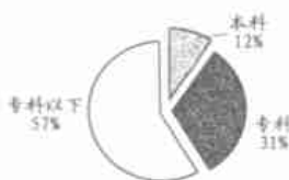
图1 经济欠发达地区农村学校体育教练员学历情况圆屏图

经济欠发达地区农村学校体育教练员本科以上学历所占比例严重偏低,体育教练员的学历主要以大专和中专为主,甚至还有2.3%的体育教师无学历(图1)。这对于学校体育后备人才的培养将起到消极的作用。研究发现,造成农村学校体育教练员学历不合格的因素是多方面的:一是,学校领导不重视教练员的培训,教练员学历达标的工作起步晚、发展缓;二是,农村学校体育教练员常年处在教学和训练的第一线,工作繁重,难以解决工学矛盾;三是,一些高学历的体育教师的外流和跳槽,造成这一地区学校体育教练员的学历整体水平下降。