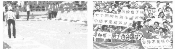
图 1 “北京球迷三大新式武器闪亮登场令客队毛骨悚然”新闻图片

2.2.1 图文并茂,视觉冲击强烈 较之其他新闻而言,体育新闻在形象性上有更高的要求,网络新闻集多种传播形式于一身,可以说是传播体育新闻最好的渠道。图文并茂的球场观众暴力网络新闻所带来的视觉冲击更为强烈。搜狐体育北京时间 2009 年 6 月 16 日的消息“北京球迷三大新式武器闪亮登场令客队毛骨悚然”,其中“三大武器、毛骨悚然”在文字上已经很吸引眼球,但是再加上如下两幅图片(图 1),其视觉冲击更为强烈。