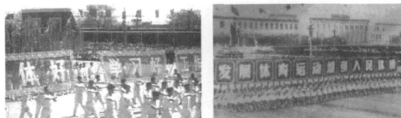
图2 初兴时期的部分体育标语

再者, 同年毛泽东的/发展体育运动, 增强人民体质 0 又一题词为新中国的体育工作指明了方向, 提出了新中国体育运动发展的根本任务, 在此方针指引下, 体育事业呈现出前所未有的欣欣向荣景象, 其后, 从毛泽东制定的我国的教育方针: /我国的教育方针, 应该使受教育者, 在德育、智育、体育几方面都得到发展, 成为有社会主义觉悟的有文化的劳动者 0 。把唤起民众投入体育运动同/卫国 0 紧密结合起来, 其直接目的是增强民众体质, 以振兴民族、挽救国家。这一精神, 贯穿于毛泽东体育思想的始终(图2)。