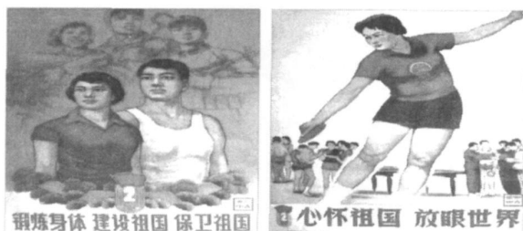
图 3 强化阶段部分体育标语

1958 年中国和国际奥委会正式断交后, 只有乒乓球等极个别的项目和国际单项协会有一些联系, 还可以参加世界比赛。而 1959 年容国团拿下第一个世界冠军后, 1961 年又将在北京举办第 26 届乒乓球世锦赛, 更为这个重点项目添足了砝码。第 26 届乒乓球世锦赛上, 中国队获三项冠军。1965 年第 28 届又夺得 5 枚金牌, 并由此创造中国乒乓球半个多世纪长盛不衰的奇迹 (图 3)。