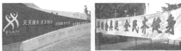
图 5 倡导全民健身的部分体育标语

魄, 好生活0、/ 全民健身, 你我同行0 全民健身体育标语的伴随与倡导下, 全民健身运动在全国如火如荼地迅速发展 (图 5)。