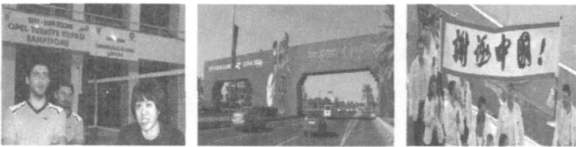
图 6 国外相关体育活动中部分体育标语

根据近几届奥运会、经济及政体不同等为依据，分别在亚洲、非洲、欧洲、美洲及大洋洲进行有选择性相关调研，对有过国外工作或学习经历的相关专家或人士，进行电话或其他方式的调查分析（表 2），结合网络资料的收集对国内外体育标语的应用进行对比分析。由于受调研难度、学术水平等因素影响，对国内外体育标语应用对比仅做表面层次上的推断式探究。对比分析结果表明：国内外体育标语的应用存在有相同点及不同之处。