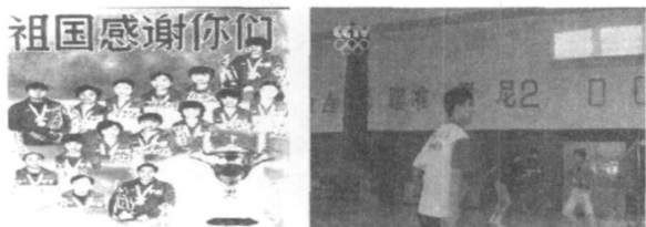
图 4 发展时期的部分体育标语

得世界杯冠军, ; 1984 年是中国体育史上极具历史意义的一年, 中国代表团不仅在洛杉矶拿到了 15 块金牌, 许海峰还射落了新中国第一枚奥运金牌, 实现奥运会金牌零的突破。确定了 / 缩短战线, 保证重点, 突出单项, 重点发展田径游泳和能在奥运会上取得好成绩的项目0 的方针。也进一步推动了竞技体育发展, 促进其他竞技运动及群众体育的全面发展。竞技体育的政治功能得到了强化, 极大渲染体育标语的应用与发展 (图 4)。